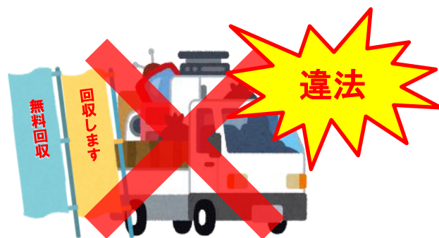
解体業者、不要品回収業者等（一般廃棄物処理業の許可なし）が回収