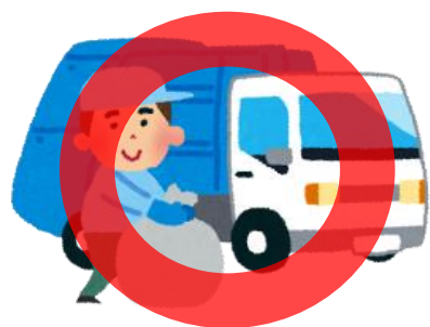
市町村の指定する方法