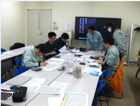
公開データの照合作業

また、公開データの確認後は施設の安全パトロールを行い、作業状況等の確認も行われました。