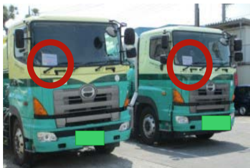
参加車両

2016年 春の交通安全運動 実施しました!! 事故は4件…事故ゼロ をめざします。