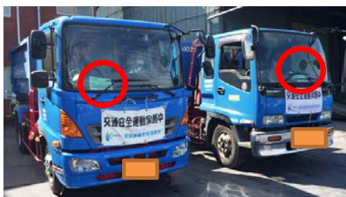
参加車両

2016年 秋の交通安全運動 実施しました!! 事故は3件…春より1 件減です。ゼロを目 指します!